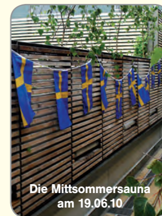
Die Mittsommersauna am 19.06.10